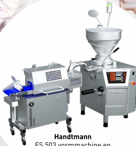
Handtmann FS 503 vormmachine en VF 806 S vacuüm vulmachine

Neem contact met ons op, om de juiste huurvorm voor u samen te stellen en voor een vrijblijvende calculatie.